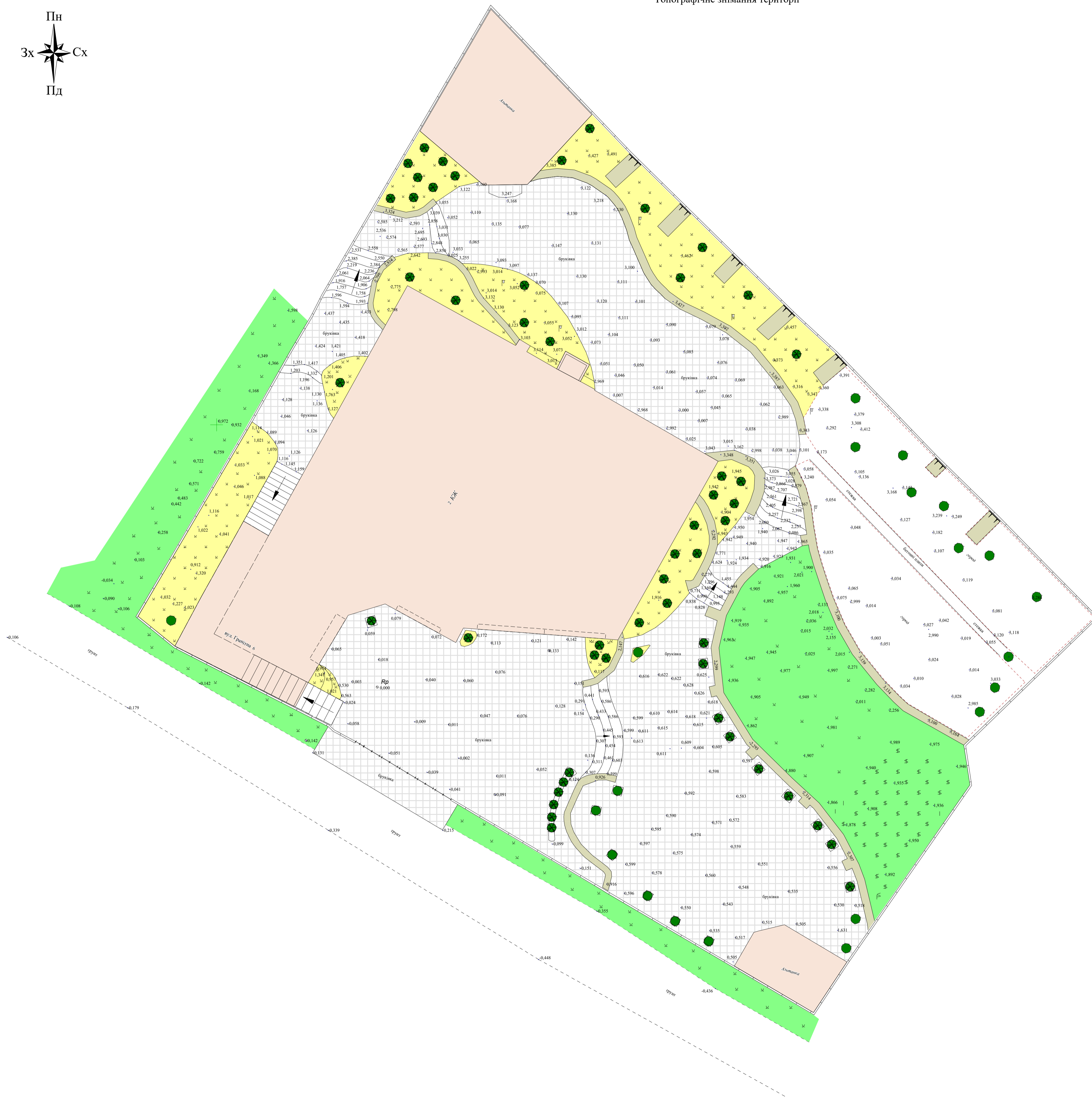
Схема розташування ділянки